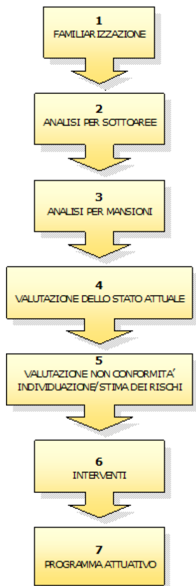
Fig. 1 Schema di Metodologia per la Valutazione dei Rischi

Nella Fase 1 (acquisizione dati), gli obiettivi sono perseguiti con opportuni incontri.